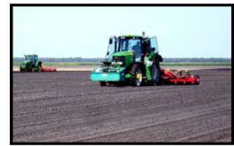
Tracteurs guidés par GPS

3. Afin de garantir des produits sains et sûrs mais aussi de réduire l'impact des cultures sur l'environnement , Pot au Pin développe une gestion maîtrisée des quantités d'eau qui sont apportées aux légumes en fonction de leur stade de développement et grâce à des bilans hydriques par sondes sur plusieurs profondeurs ainsi qu'un suivi en temps réel des conditions climatiques.