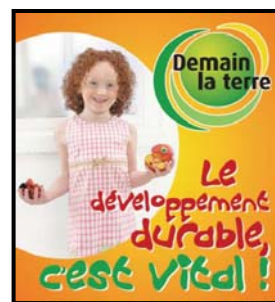
Affiche magasin, mai – juin 2006

Des dépliants pédagogiques et d'information, stop rayons et affiches en magasins permettent ainsi de théâtraliser cette opération et d'expliquer aux consommateurs les actions entreprises.