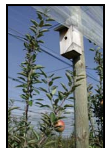
300 Nichoirs pour la Mésange Bleue dans les vergers

D'autres producteurs de Demain la Terre oeuvrent également en ce sens, notamment les producteurs de pommes qui ont installé 800 nichoirs dans leurs vergers pour sauver la mésange bleue , espèce en voie de disparition et par ailleurs excellent « insecticide naturel ».